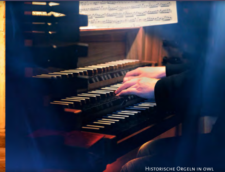
HISTORISCHE ORGELN IN OWL