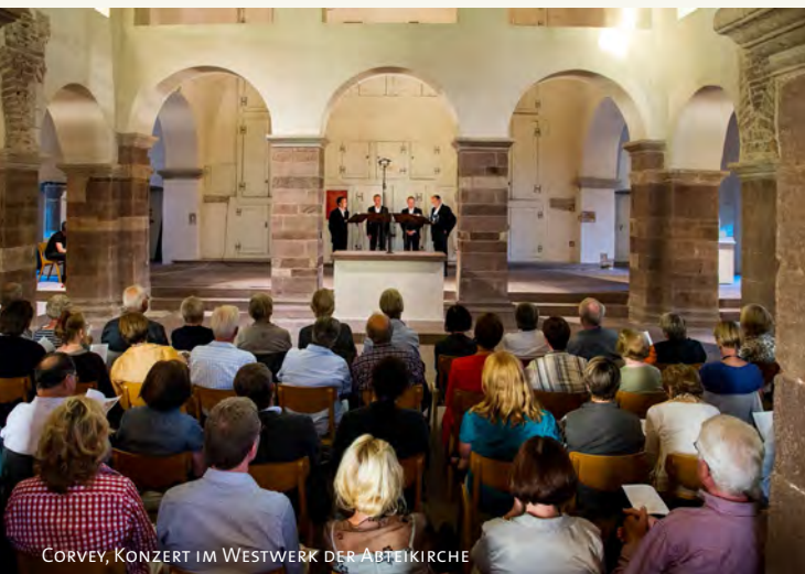
CORVEY, KONZERT IM WESTWERK DER ABTEIKIRCHE