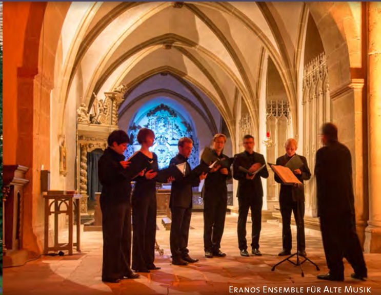
ERANOS ENSEMBLE FÜR ALTE MUSIK