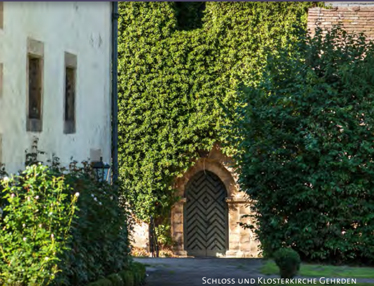
SCHLOSS UND KLOSTERKIRCHE GEHRDEN